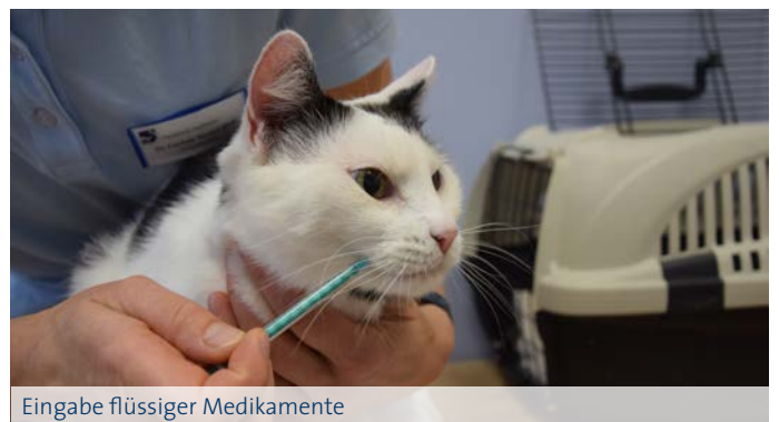
Eingabe flüssiger Medikamente