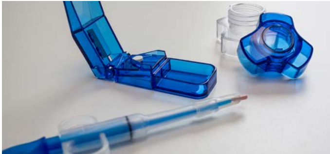
Tabletteneingaber (re.), Tablettenmörser (li.) und Tablettenzerteiler (oben) sind praktische Hilfsmittel