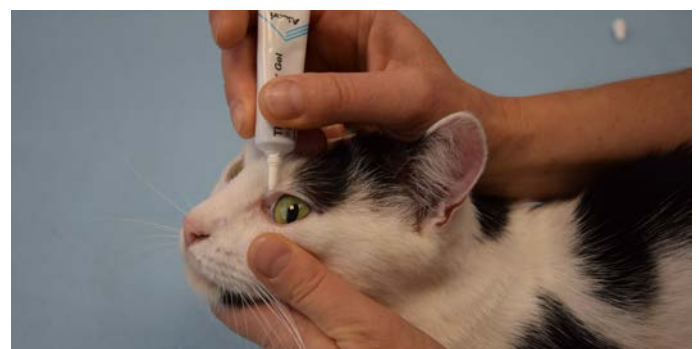
Einbringen von Salbe in das Auge