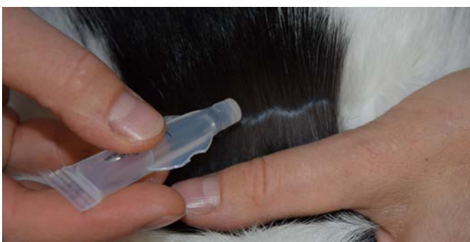
Aufbringen eines Spot-on Präparates auf die Haut

!ACHTUNG! Verwenden Sie niemals Flohpräparate für Hunde bei Katzen! Manche enthalten hochkonzentriertes Permethrin, einen Wirkstoff, der für Katzen tödlich sein kann. Bei Unsicherheiten sprechen Sie uns bitte an!