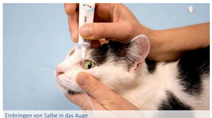
Einbringen von Salbe in das Auge