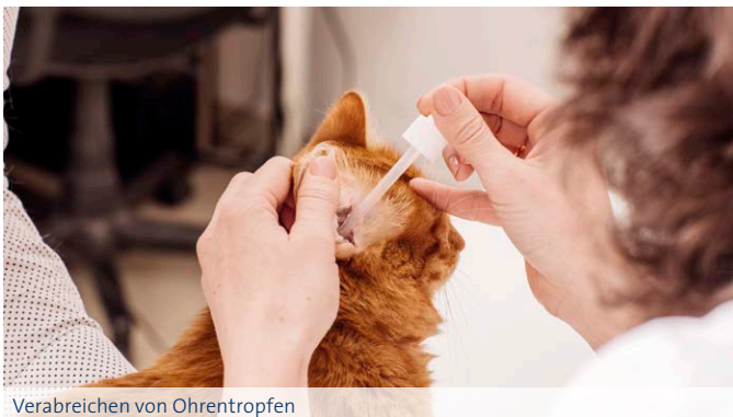
Verabreichen von Ohrentropfen