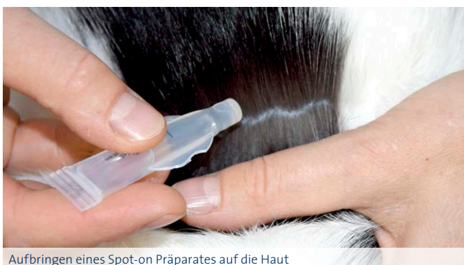
Aufbringen eines Spot-on Präparates auf die Haut

ACHTUNG: Verwenden Sie niemals Flohpräparate für Hunde bei Katzen! Manche enthalten hochkonzentriertes Permethrin, einen Wirkstoff, der für Katzen tödlich sein kann. Bei Unsicherheiten sprechen Sie uns bitte an!