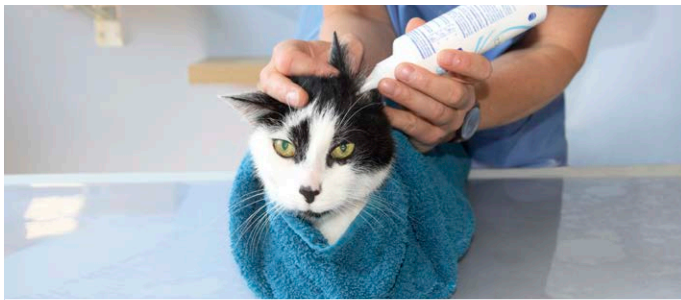
Trick bei der Verabreichung von Medikamenten: wickeln Sie Ihre Katze vorsichtig in ein Handtuch, damit sie nicht kratzen kann (vgl. das Informationsblatt „Handtuchwickeltechnik“)