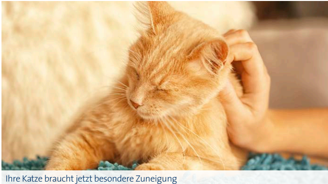
Ihre Katze braucht jetzt besondere Zuneigung