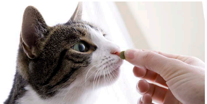
Probieren Sie beim Füttern Alternativen aus.