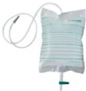
Abbildung: fest angeschlossener Urinbeutel

Zum Schließen: grünen Hahn nach rechts drehen (Evtl. kann der Beutel unter das pet-shirt, das Ihr Tier trägt, geschoben werden)